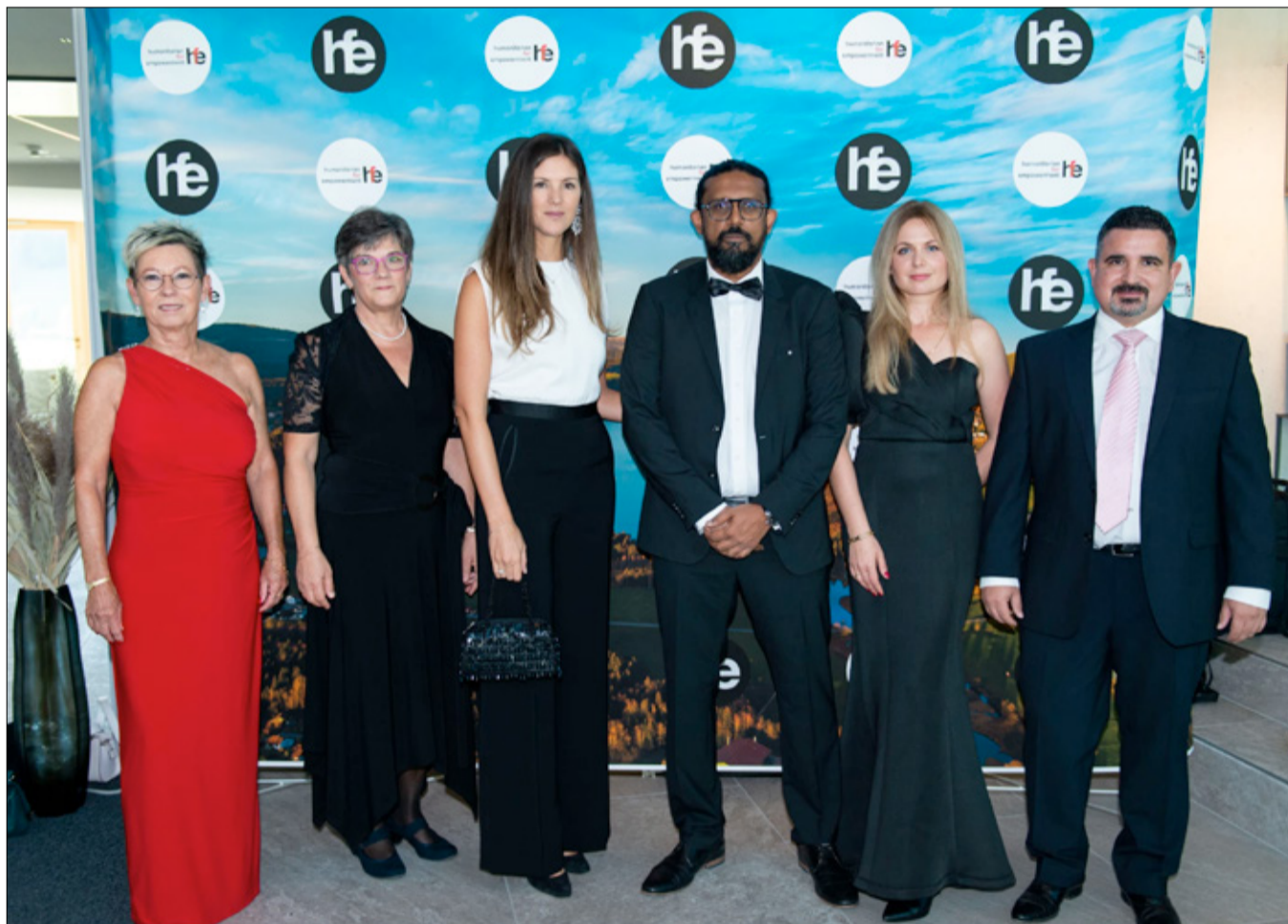
Les membres de la fondation Humanitarian For Empowerment.

Dans la plupart des hôpitaux, ils ont déjà l'équipement, mais il manque un savoir-faire, et c'est là où nous voulons intervenir. Ce type d'aide humanitaire est différent des autres